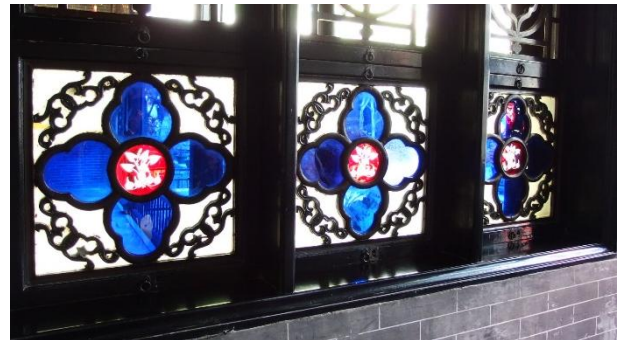
進口的彩色玻璃窗