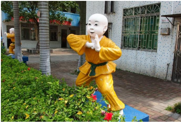
校園中武德小童雕塑情境布置

學校的校長及地區的督學帶領我們參觀校園以及較新建的教學大樓中的教室。這所學校的多功能教室充足與硬體建設完善，包括視聽教室、藏書室、閱覽室、美術室、寫生室、實驗室、烹飪室等，校方帶著我們一間一間的參觀。有些教室中不乏有大尺寸的液晶螢幕。參觀這些不同功能的專科教室，我意識到這所學校可能提供了比臺灣更多元的課程與學習。