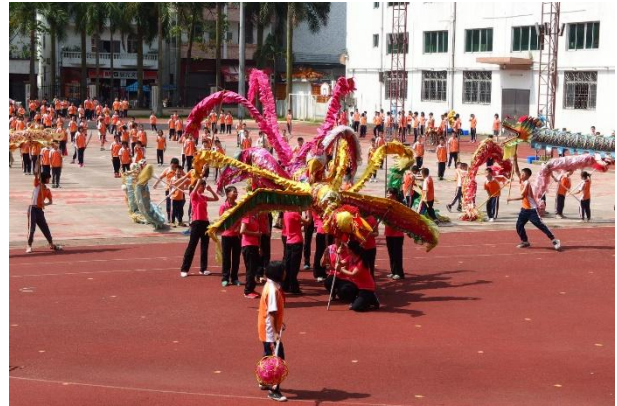
學校女老師們也下場「舞鳳」

學校本身就應具有文化傳承的功能，一個學校辦學的特色如果要長久、穩固，恐怕無法憑空創造，也須從在地的歷史文化出發。這樣的特色學校經營的基本原則，不僅在臺灣適用，在中國也是一樣。沙灣實驗小學以「武術」為學校本位的課程活動，是根植於沙坑村的傳統文化。佛山是武術之鄉，1950 年代初因修建佛山機場，佛山南海區整條村遷徙到番禺的沙灣鎮沙坑村，也因此將武術、南海醒獅等的傳統民間藝術傳承過來。沙灣實驗小學繼承傳統武術的優點，體育課堂中把武術作為全校學生的必學項目。其中一、二年級以學校自編的武術操學習為主，三、四年級以短器械學習為主，五年級以長器械學習為主，而六年級則以太極拳學習為主。更開設了現代競技武術，成立學校武術代表隊，參加各種武術比賽，為國家競技體育貢獻一些力量。在教育哲學上，堅持「以武術辦校，以武德興校」的指導思想，將「武德」融貫於各個學科教學中，進行禮儀、誠信、仁義等德行的教育。2010 年，該校被中國體育總局辦公廳和教育部辦公廳評為「國家級武術傳統項目學校」，是廣東省唯一一所獲此殊榮的學校，可見這所學校特色的發展受到國家級的重視。