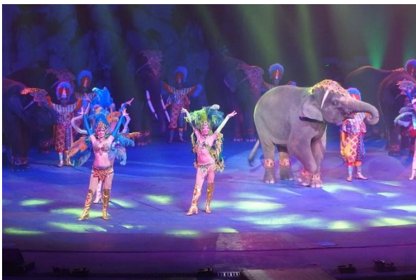
長隆大馬戲團精彩的表演

這趟交流的行程中，也安排了長隆大馬戲團的表演，以及搭乘郵輪夜遊珠江的體驗。我是第一次觀賞馬戲團表演，現場的感覺很震撼，觀眾們也很激動，在節目的表演過程中驚嘆連連、掌聲不斷。不過，我是人道主義者，對於節目中動物的演出部分有些不忍，擔心這些動物訓練過程可能受到不人道的對待。至於夜遊珠江，欣賞到珠江兩岸高樓大廈的點燈裝飾，還有美麗、色彩多變的廣州塔，讚嘆廣州市的發達與繁榮。