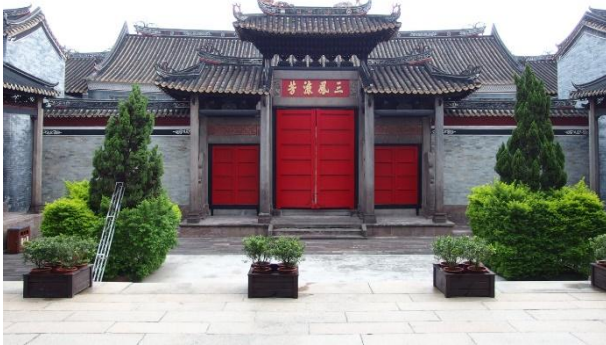
留耕堂是沙灣何氏家族的宗祠

參觀留耕堂可以感受到傳統中國家族的影響力及宗族觀。堂中的祖訓告誡著後代祖孫不可違背祖先的規定，兩旁放置古裝劇公堂中看到的丈板，違反者會有家罰。另外，據導覽員的解說，堂中的匾額在文化大革命時期裹上泥土塗黑才躲過一劫，可想見中國許多傳統的物質與精神的文化歷經文化大革命的破壞。