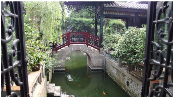
傳統中國式的小橋流水建築

第一天下午參觀的景點。百餘年建築的余蔭山房，是清代舉人退隱後的私人花園。傳統中國式的建築，古色古香，有山有水，有樹有花，有小橋、有廳堂、有字畫。可以感覺出中國古代仕紳的奢華與風雅。印象深刻的是進口的彩色玻璃窗和能照出全身的鏡子，清代就有了，讓傳統的建築與現代的工藝有了一點連結。另外，有些房間的屏風、擺飾讓人不知道是當時就有，還是後來才放上的，應該加以標註說明。如果有太多後來才加上的東西，就會失去原汁原味的感覺。