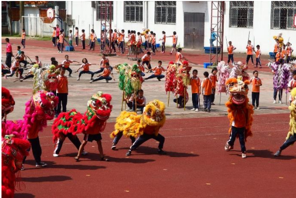
全校動員的「大課間」演出