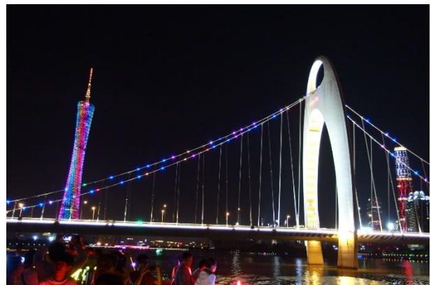
乘郵輪夜遊珠江欣賞廣州塔及岸上夜景