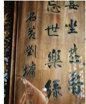
清代劉墉題字的木匾