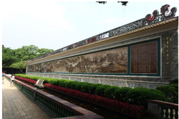
瓷塑浮雕的「清明上河圖」