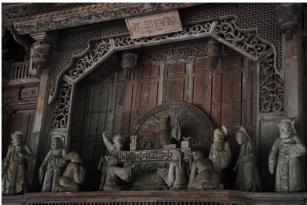
長廊牆上石雕為民間包公故事圖