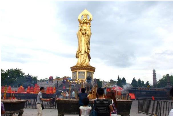
蓮花山裡 40 多公尺高的觀世音像

其他參訪的景點也是很有意義，在「蓮花山」有 40 多公尺高的觀世音像，我們還一起一階階的攀登上 50 公尺的蓮花塔，留下難忘的回憶。「西漢南越博物館」裡，看到了許多出土的文物，彷彿穿越時空，體會到西漢南越人的生活智慧。「中山紀念堂」中，雖然早已經熟悉孫中山的歷史事蹟，但是親臨此地，別有一番感受。另外，我們也參訪了荔灣區芳村的茶葉市場，品嚐了名茶。芳村家家都是茶行，像是茶葉的集散地，走在街上彷彿可以聞見茶香。據說廣州市飲茶的文化反而是臺灣商人引進的，可見於中國的大市場，到處都是賺錢的商機。