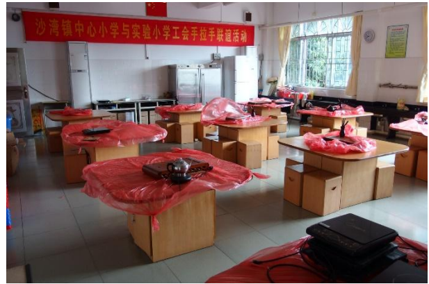
沙灣實驗小學的茶藝教室

緊接著校方安排全校性的表演。我們一行人排排坐在司令臺上，感覺受到貴賓式的待遇，欣賞臺下全校七百多位師生壯觀的演出。我從沒實際見過這麼壯觀的場景，像這麼多人同時演出的場面，以往只會在電視上的國慶大會才看得到。學生們先吹奏豎笛（直笛），搭配著簡單的手部動作與走位變換隊形，接著是手語歌、武術。武術的表演除了有拳、棍外，還有舞旗、舞龍、舞獅，該校的女老師們也下場「舞鳳」。表演結束後，我們一行人也技癢下場試試舞鳳，鳳凰道具還挺有重量的，可以想像這群女老師平常練習的辛苦。