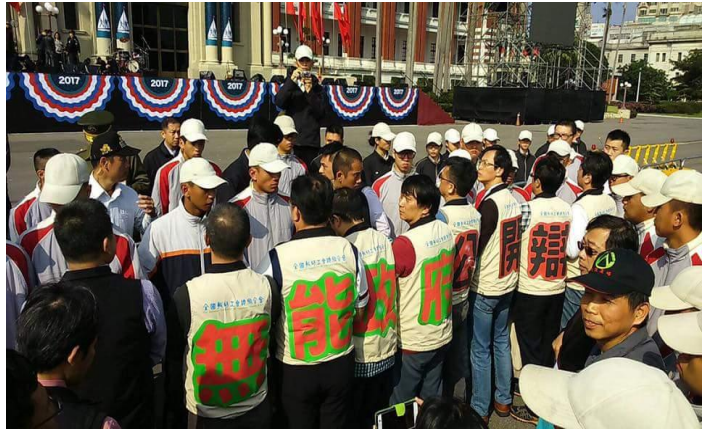
無能政府 公開辯論