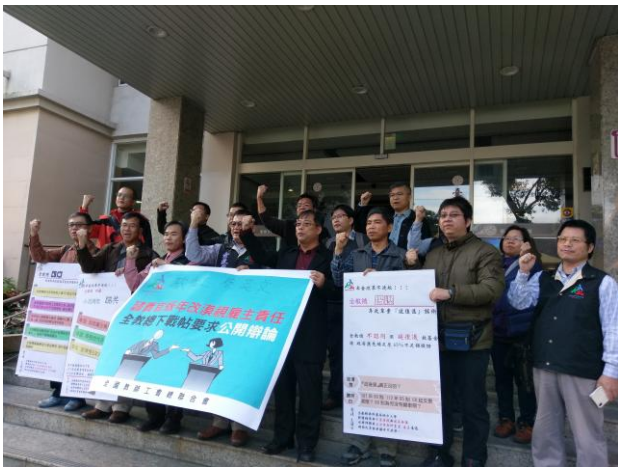
全教總及各地方教師工會向僱主下戰帖