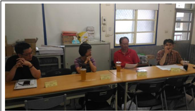
臺南市107年度SUPER教師獎決選會議

SUPER教師獎甄選 愈來愈受到本市教師的重視，今年國中組報名情況尤其踴躍。本會希望透過SUPER教師獎的甄選，真正鼓勵長期默默耕耘教育福田，表揚對教學工作有熱忱、教材研發有創意、班級經營有活力、學校興革有助益、弱勢關懷盡心力，深受學生、同事、家長喜愛，對教育有深刻影響力之教師。