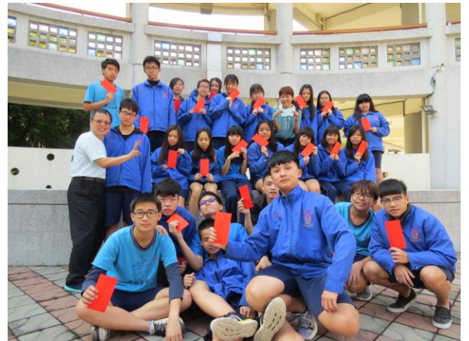
志霖老師與學生合照