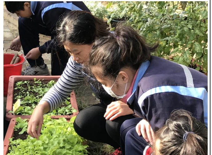
淑媛老師與學生合照