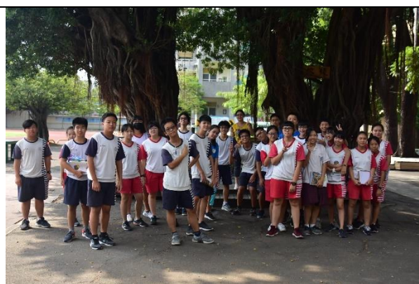
黃鈺心老師與學生合照