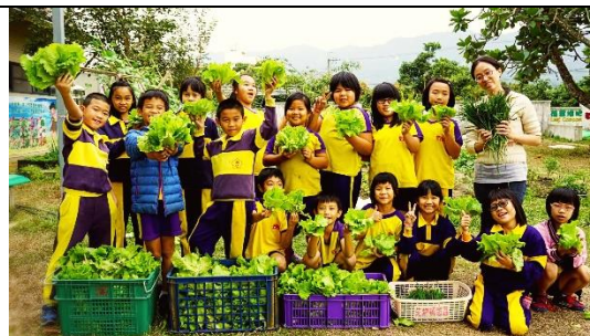
許游雅老師與學生合照