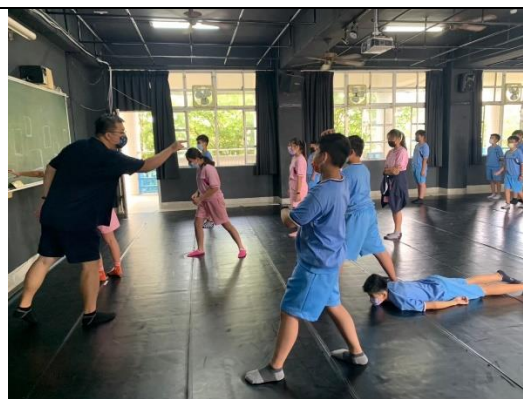
蔡育錚老師與學生合照